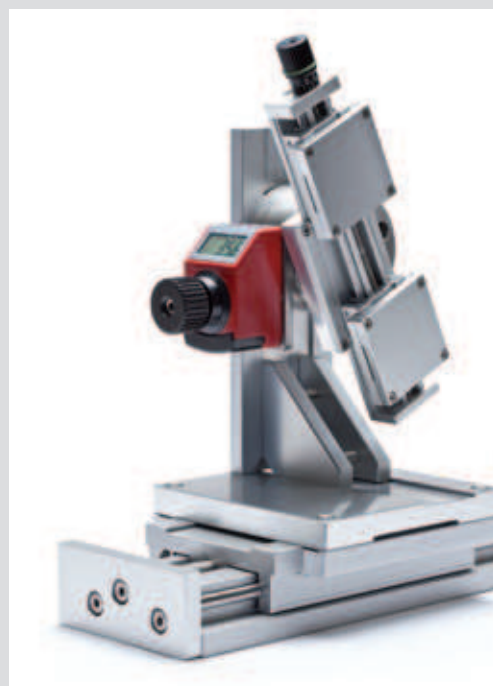
domiLINE mit MDV und doppeltem Schlitten mit Links-Rechts-Spindel domiLINE with MDV and double slide with left-right-spindle

Easy and well visible read of the position make the integrated counters to a usefull option of the domiLINE and MDV product program. Four assembly variants for horizontal and vertical assembly. The positioning indicator are receivable in mechanical and electronic version.