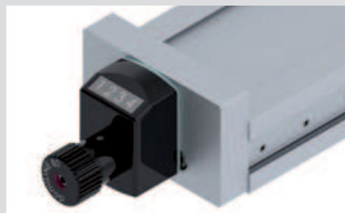
Mechanische Positionsanzeige Mechanical position indicator

Einfaches und gut sichtbares Ablesen der Position machen die Positionsanzeigen zu einer nützlichen Option der domiLINE- und MDV-Produktpalette. Es stehen jeweils vier Montagevarianten für den horizontalen und den vertikalen Anbau zur Verfügung und sind als mechanische und elektronische Version erhältlich.