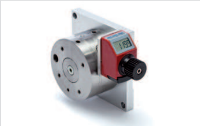
MDV 80 mit elektronischer Positionsanzeige MDV 80 with electronic position indicator